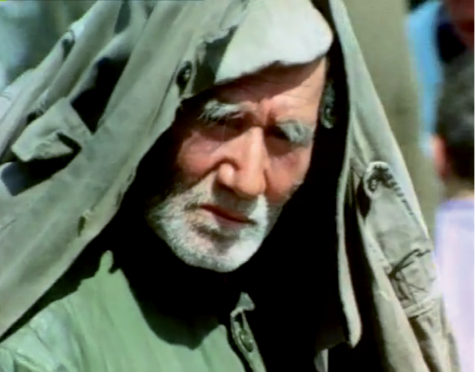
Filippos Koutsaftis, La pierre triste.

Dix années de réalisation, filmé en pellicule, le film témoigne de l’abandon du site du sanc-tuaire des Grandes Déesses, où se pratiquaient les rites d’initiation aux mystères d’Éleusis. D’importants vestiges ont été détruits et recouverts par l’urbanisme et l’industrie moderne, un véritable effacement. Un personnage énigmatique guide Koutsaftis pendant le tournage. Opiniâtre gardien des ruines, il sauve quelques débris épars ; on le voit passer, on ne sait pas d’où il vient, ni où il va, il est là. La phrase « Je vis sur la terre et sous les nuages », suivie dans le film par « comment on appelle ça ? », est de lui. On se demandait pourquoi cet homme, considéré comme fou, ou demeuré, par les habitants des lieux portait toujours une veste sur la tête, un abri déjà. Dans la tradition soufi, il est mentionné que les anciens penseurs, les sages, avaient pour habitude de se couvrir la tête d’un manteau. En s’isolant des autres et de leur environnement, ils restaient ainsi concentrés sur leurs propres perceptions. Grâce à cette continance de la vision, ils pouvaient atteindre une acuité susceptible de pénétrer pierres et montagnes.