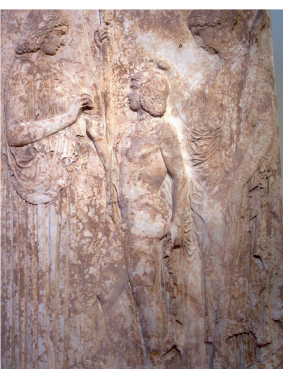
Grande stèle des mystères d’Éleusis, Déméter remet les grains à Triptolème sous les yeux de Coré. Musée national archéologique d’Athènes.

Au verso, et en guise d’ouverture, l’image d’une figure géométrique apparue dans la nuit du 4 au 5 septembre 2020 dans un champ de culture du sud-ouest de l’Angleterre. Depuis une quarantaine d’années, d’étranges dessins apparaissent sur des terres cultivées, en Europe et dans le monde, avec une grande concentration dans le comté du Wiltshire, au sud-ouest de l’Angleterre. Si certains ont été réalisés par des humains, la majorité d’entre eux reste inexploquée. Manifestations troublantes qui viennent interroger notre relation à l’insondable et au mystère.