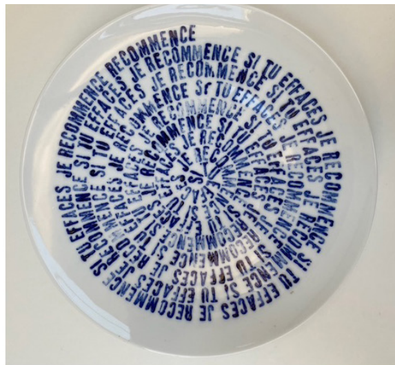
Porcelaine de Limoges - Jean-François Demeure

Les œuvres d'artistes sont parfois des prétextes à produire d'autres textes. Ces auteurs sont en quelque sorte des plongeurs qui m'offrent de possibles rebonds pour me jeter nu dans l'encre de la page blanche. Quatre de ces textes seront livrés à l'écoute du public.